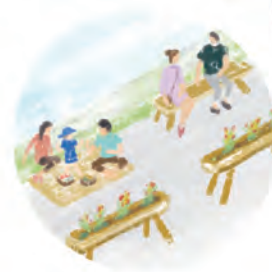
交通再編で 道を楽しむ

リバーフェスタと並行して、温泉街では常設化に向けて3つの社会実験を行っています。①川を楽しむ川床や置き座（テラス）の設置実験、②湯本提灯や橋などのライトアップで夜を楽しむ照明実験、③道路の一部をブースや休憩スペースに活用する空間再編実験。これらも是非体験してみてください！