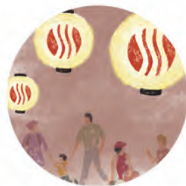
湯本提灯と照明で 夜を楽しむ