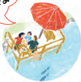
川床・置き座で 川を楽しむ